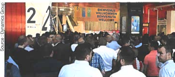
En 2017, deux tiers des 800 exposants de EPHJ-EPMT-SMT étaient actifs dans le médical.

Synergie - En associant les technologies médicales au savoir-faire horloger et aux microtechnologies, le salon gene-